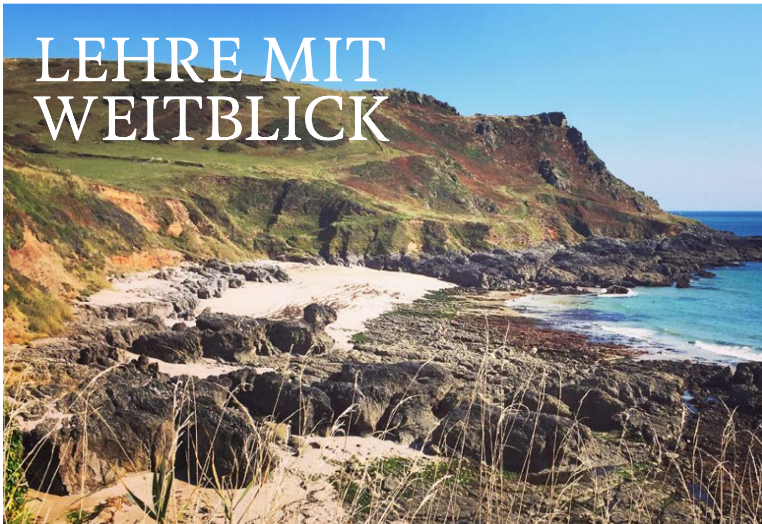
Devon, Start Point

Die KV Luzern Berufsfachschule bietet die «kv plus-Lehre» an. Was ist das Plus an der neuen Lehre? Vier Absolvierende berichten über ihre Erfahrungen.