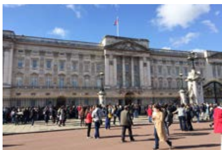
London, Buckingham Palace

Während dieses Jahres kam ich dreimal für einen Kurzaufenthalt zurück in die Schweiz, einmal extra wegen der Luzerner Fasnacht. Darauf wollte ich nicht verzichten. Umgekehrt besuchten mich auch meine Eltern und Freunde. Wir hatten uns die Trennung schlimmer vorgestellt. Heimweh hatte ich eigentlich nie.»