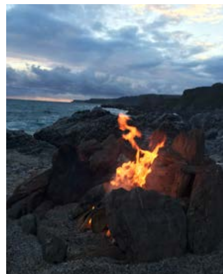
Start Point, Campingfeuer auf dem Strand

Da wir fast keine Hausaufgaben erledigen mussten, verfügten wir – die Teilnehmer von kv plus – über recht viel Freizeit und haben uns oft getroffen. Insgesamt war das Leben etwas lockerer als hier.»