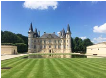
Pauillac, Château Pichon-Longueville-Baron

darf sagen, dass auch der Lehrbetrieb von so einem Auslandsaufenthalt ihres Lernenden profitiert. Ausser der jeweiligen Fremdsprache macht man auch vielfältige Erfahrungen im Alltag. Man wird immer mal wieder mit unbekannten Situationen konfrontiert. Wenn da also beispielsweise ein Zug wegen Hochwasser ausfällt, steht nicht gleich ein Ersatzbus da wie in der Schweiz, und man kann auch nicht einfach zu Hause anrufen. Da ist man ganz auf sich gestellt und muss sich etwas einfallen lassen. Ich denke, man ist am Ende dieses speziellen dritten Lehrjahres ein gutes Stück selbstständiger.