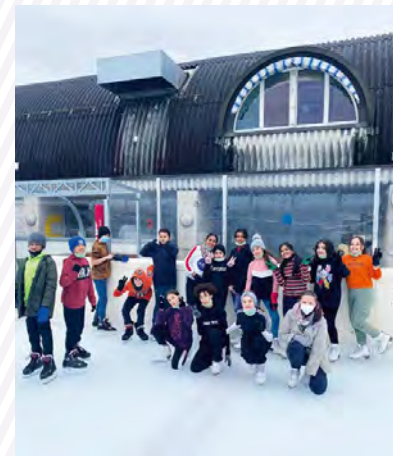
Sortie patinoire avec la classe!