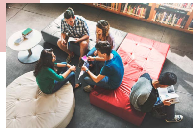
Concept de communication Movetia